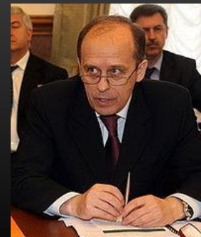
Директор ФСБ Бортников А.В.