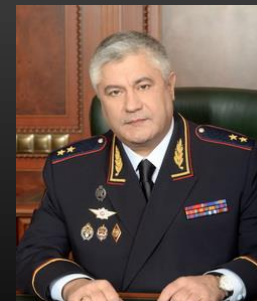
Владимир Александрович Колокольцев