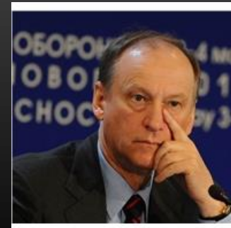
Патрушев Николай Платонович, секретарь СБ