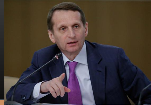
Нарышкин Сергей Евгеньевич